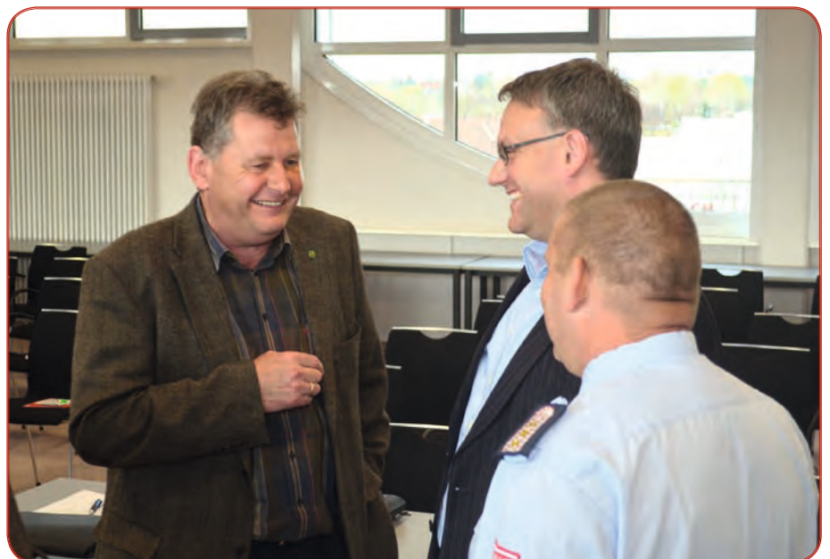
Die Streitigkeiten um die Mitgliedschaft der Feuerwehren an der Finne konnten nun auch beigelegt werden. Während der Delegiertenversammlung wurde entsprechende Einigkeit erreicht.